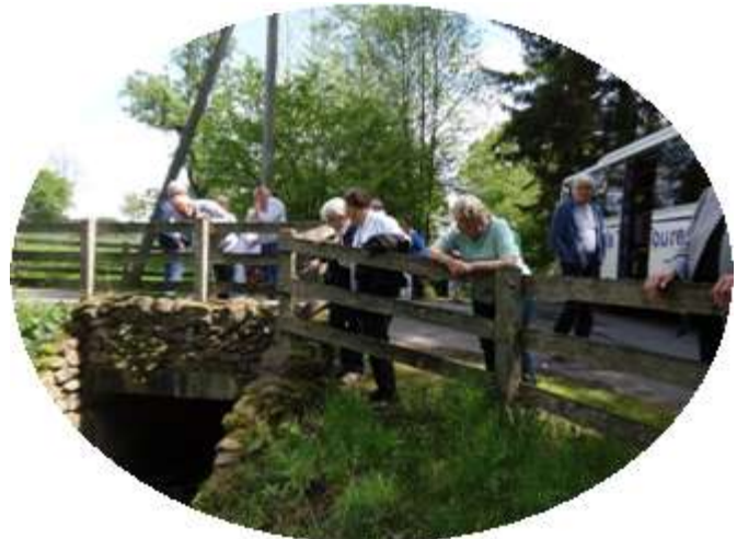
De bron van de Vecht Darfeld

De busexcursie droeg de titel "Op ontdekkingstocht langs de Vecht" De Vecht is ooit in het Munsterland bij Ober