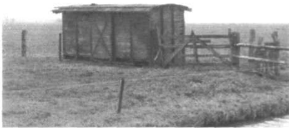
het vijf-tons "Allan" bovendeel van een EDS goederenwagon in het Staphorster veld.