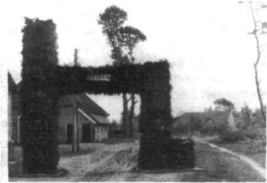
Ereboog in 1947 t.g.v. 25 jarig bestaan School II (Bargermeerweg). "In de boog": boerderij Stel, verderop boerderij Pathuis. Helemaal links-gedeeltelijk- boerderij Harmannus Sikken

Op de hoogveengronden -gepacht van de markegenoten van Noord- en Zuidbarga- verbouwde men boekweit met het bijkomend voordeel dat dit product geen bemesting nodig had. 4). Tussen Den Oever en het meer lag de z.g. Kalverkamp, een perceel groenland dat als weide voor jonge kalveren werd gebruikt. In het meer zelf waren twee diepere gedeelten, de zogenaamde kollings. Zo kende men de Fokkenkolling en de Oevermanskolling of Oevermanskolk. In dit verband is het opmerkelijk dat in de volksmond Oranjedorp in vroegere jaren ook wel Kollingsveen werd genoemd.