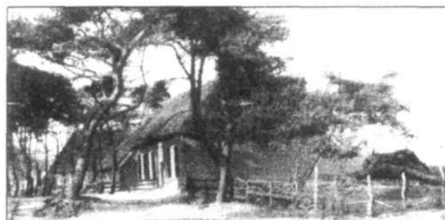
Boerderij bij het Oevertbos

in 1941- had niet alleen een intense belangstelling voor dieren, ook met het fotograferen van met name landelijke taferelen in de omgeving van zijn geboortedorp hield deze natuurliefhebber zich bezig. Zeker in die tijd een opvallende bezigheid! Een van zijn foto's ziet U onderstaand en is gemaakt 'op' Den Oever. Een aanleiding om ons te verdiepen in een aantal aspecten van de geschiedenis van deze buurschap. 3)