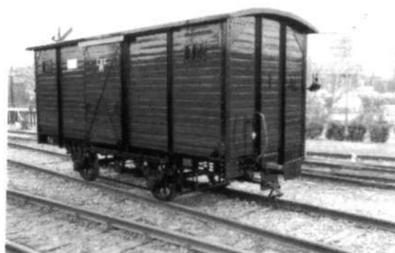
Pas gerestaureerde wagon EDS-85

Al vanaf 1995 heb ik contacten met het museum "Stoomtram Hoorn - Medemblik", daarna ben ik lid geworden om op de hoogte te blijven met de historie van trams, zoals dat vroeger ook in Dedemsvaart het geval was. Dit museum heeft ruim 60 foto's van mij gekregen van de DSM en de EDS, met daarop o.a. gebouwen, locomotieven en wagens. Nu het museum in Hoorn een wagon van de EDS heeft gerestaureerd, is dit leuk te vermelden aan de leden van de historische vereniging en andere belangstellenden. Het adres van het museum "Stoomtram Hoorn Medemblik" is: Van Dedemstraat 8, Hoorn.