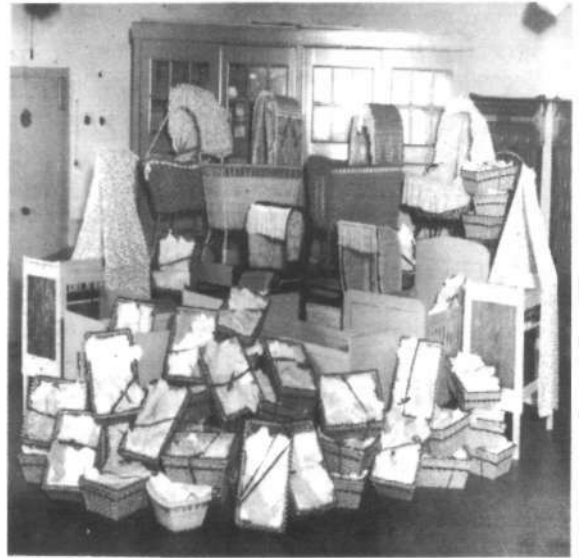
Zes en vijftig gelukkige moeders

arme gezinnen. Ook in Emmen was men actief.