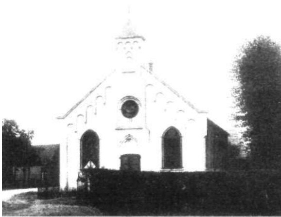
Witte kerkje Sterrenkamp hv, het zogenaamde chocoladekerkje.

maakte zich los van de hervormde gemeente, maar zij bleef, anders dan de 'afgescheidenen', binnen de hervormde gemeente, vormde daar een eigen groepering, later ook met een eigen kerkgebouw: de Kapel.