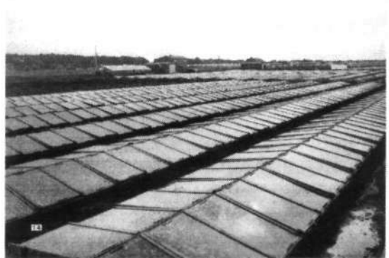
Erica, tuinbouwbakken voor o.a. komkommers

In de jaren dertig van de twintigste eeuw verkeerde de wereld in een economische crisis. Dit had vanzelfsprekend grote gevolgen voor de Nederlandse land- en tuinbouw die voor een deel steun op de export. Exportbelemmerende maatregelen door buitenlandse overheden, overproductie en achterblijvende afzet in eigen land dwongen de Nederlandse rijksoverheid tot ingrijpen. Het gevolg was een ingrijpende crisiswetgeving waarbij bedrijfstakken als de bloembollensector gesaneerd werden. Door het afgeven van teeltvergunningen werd de productie verkleind. Het gevolg was wel dat met name de kleine boeren en tuinders financieel dermate achteruitgingen dat het water hen aan de lippen kwam te staan. Dit werd uiteindelijk door de regering erkend en vanaf eind jaren dertig konden kleine boeren en later ook de kleine tuinders op geldelijke steun rekenen. Bij toeval zijn voor een deel van de gemeenten de aanvragen om steun bewaard gebleven. Bij een-teelt was sprake van een groente, bij twee-teelt van twee groenten al dan niet tegelijkertijd, steeds echter op de volle grond.