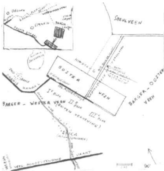
Overzichtkaart van de omgeving van het Oosterveen en het Smeulveen Circa 1865. Tekening WV

om de uitgestrekte venen van Zuidoost-Drenthe - het 'bruine goud' - aan te snijden. Het ging dus om een soort goldrush. Een in die jaren een tot de verbeelding sprekend fenomeen. In Amerika werden in die tijd veel goudvondsten gedaan, wat in Nederland niet onopgemerkt was gebleven. Daarnaast werd ook nog eens het 'nationale gevoel' versterkt toen de maatschappij ook nog eens het exclusieve recht kreeg om het kanaal Oranjekanaal te mogen noemen. Het kon dan ook niet anders dan dat de ondernemers gingen 'voor goud'. Al in 1853 had de maatschappij van de boermarke van Noord- en Zuidbarge twee grote complexen veen gekocht, in totaal zo'n 1.500 hectaren. Het ging hier om het onder Zuidbarge gelegen Oosterveen, groot 560 ha en het op enige afstand noordoostelijk daarvan gelegen Smeulveen van 978 ha. De tussen beide veencomplexen gelegen gronden - op een uitloper van de Hondsrug, waar later Nieuw-Dordrecht zou ontstaan - waren door hun hoge ligging ongeschikt voor vervening.