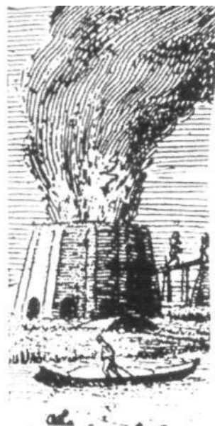
Zo moet de kalkoven aan het Oranjekanaal bij Zuidbarge in 1858 er ongeveer hebben uitgezien (met de vorm van een afgeknotte kegel) uit: bijdrage Land van Ussel en Vecht 1977.

veen op de westelijke grens van het Oosterveen. Hier zou de verlenging van het Oranjekanaal zou worden aangelegd. Pas als het veen daar was verwijderd, kon er een zogenaamd hulpkanaal in het zand worden uitgegraven. Dit zou het begin zijn van de later zo genoemde Bladderswijk.