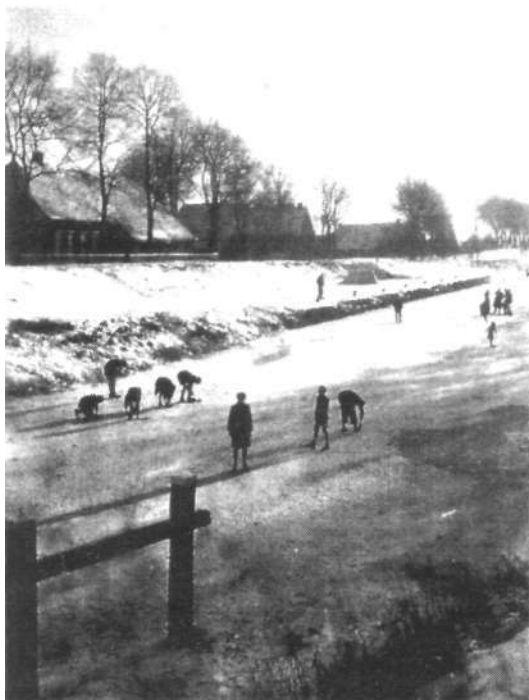
Boerderij Eiting en Staal

Beide tentoonstellingen zijn tot en met 3 september te zien tijdens openingsuren van het gemeentehuis en op zaterdag- en zondagmiddag van 14.00-16.00 uur (ingang gemeentehuis bij het busstation.) De toegang is gratis.