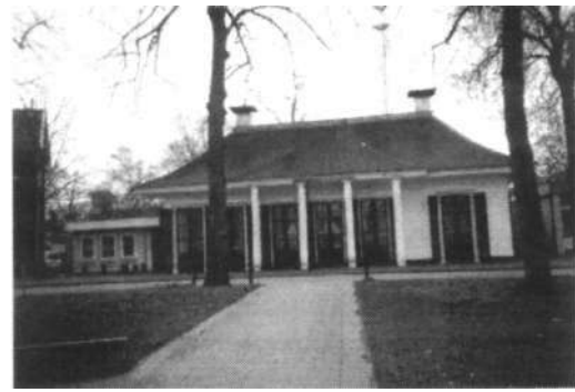
Voormalig kantoor en dienstwoning van de Oraryekanaabnaatschappij. Hier woonde jarenlang de hoofdopzichter Joh. Lokker. Later kantongerechtsgebouw te Emmen.