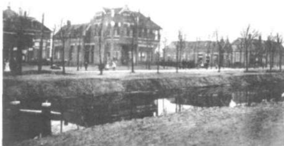
Oosterdiep (doorscheep) te Emmer Compascuum

Arrest nr 143 van 24-3-1932 van het Gerechtshof Leeuwarden luidde: "Het beroep op noodweer wordt verworpen" en daarom werd het vonnis gehandhaafd als "prima"= dus onveranderd. Jan van Klinken verhuisde op 4 augustus 1932 naar Bellingwolde, kwam op 5 mei 1938 naar Emmen en vastigde zich op 1 oktober 1938 weer aan de Oostelijke Doorsnee zz 6 in Emmer-Compascuum