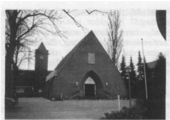
De Kapel, gezien vanuit de Kapelstraat