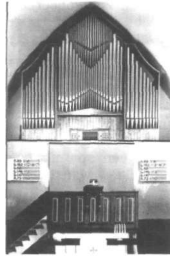
Orgel Hervormde Kapel

inhoudelijke geloofsverschillen een noodzakelijke reden waren tot scheuring.