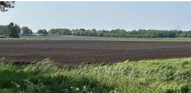
Afb. 15. (A. Eggens, 13 mei 2024)