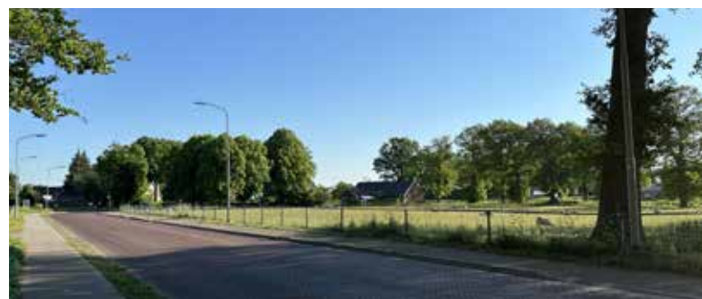
Afb. 11. (A. Eggens, 14 mei 2024)