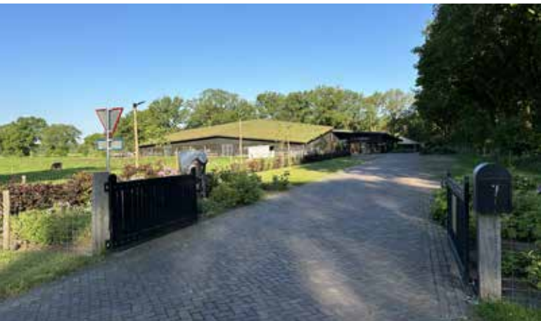
Afb. 3. (A. Eggens, 14 mei 2024)