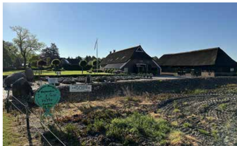
Afb. 10. (A. Eggens, 14 mei 2024)

Dat geldt ook voor het fietspad langs de Bergweg (zie afb. 12). Al jaren maken schots en scheef liggende betonplaten daar een deel van het wegdek uit. Misschien een aantrekkelijk parcours voor de avontuurlijke mountainbiker, maar zeer onwenselijk voor de nietsvermoedende wielrijder die veilig