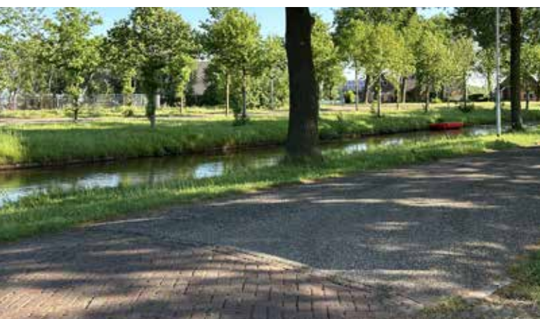
Afb. 19. (A. Eggens, 14 mei 2024)

Ter Apel is zeer goed over het water te bereiken. Er zijn verbindingen richting Stadskanaal en verder noordwaarts, Duitsland en via Emmer-Compasuum met de rest van Nederland (zie afb. 20). Watertoeristen weten Ter Apel goed te vinden. Speciaal voor hen is er in het dorp een jachthaven. Regelmatig moeten bruggen over het Ter Apelkanaal worden afgedraaid of omhoog gehesen, zodat de boten verder kunnen varen. Leerlingen die te laat in de les verschijnen, gebruiken met name in de zomermaanden geregeld als excuses 'dat de brug openstond'. Net over de Roswinkelerbrug stond vroeger het station van de Eerste Drentsche Stoomtramweg-