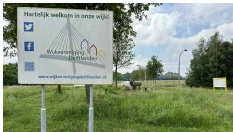
Afb. 1.

foto's daar laten maken (zie afb. 2). Geen verre oorden waar je een vreemdeling bent. Hier komen wij weg!