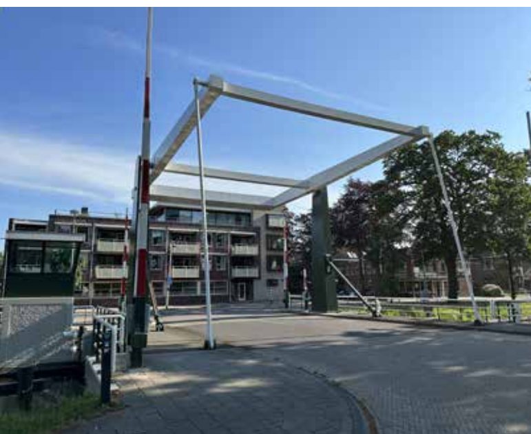
Afb. 22. (A. Eggens, 21 mei 2024)