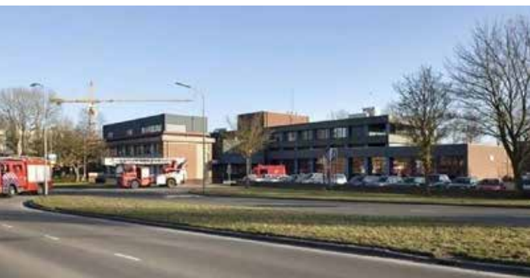
Boven: Afb. 6. ( http://emmen.serc.nl/nostalgie-oude-fotos/oud-emmen/10/ )