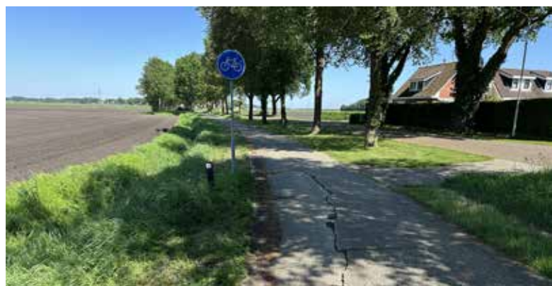
Afb. 12. (A. Eggens, 13 mei 2024)