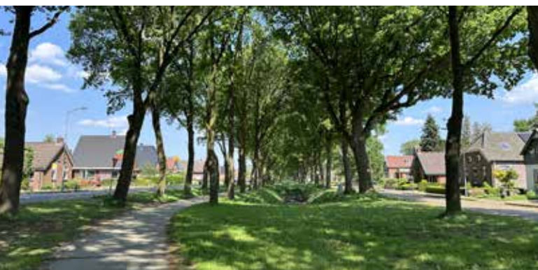
Boven: Afb. 16. (A. Eggens, 13 mei 2024)