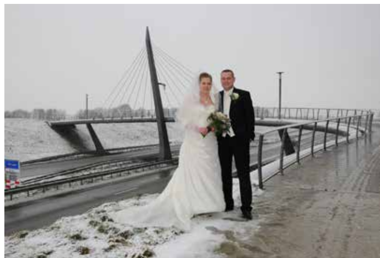
Afb. 2. (Collectie A. Eggens, 29 januari 2010)