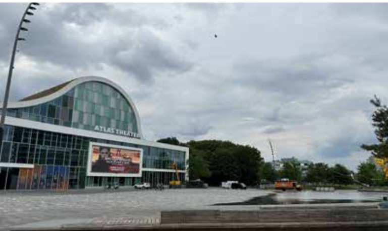
Afb. 8. (A. Eggens, 14 mei 2024)