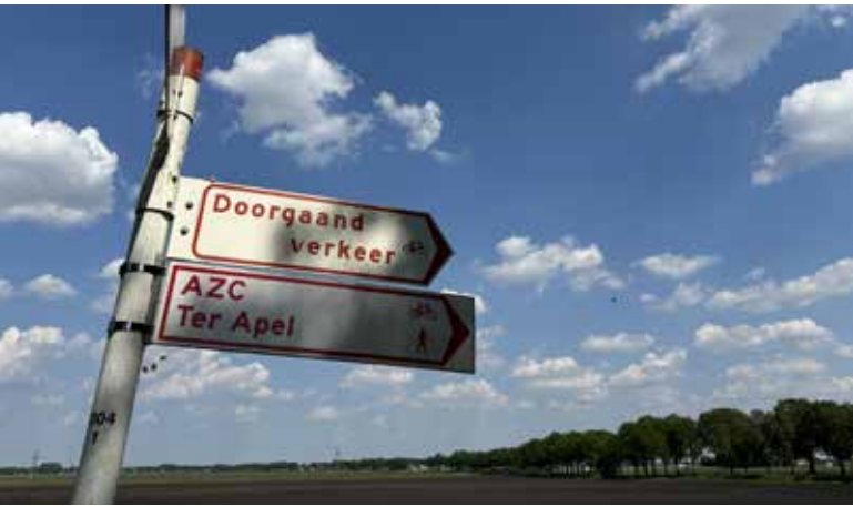
Afb. 13. (A. Eggens, 14 mei 2024)