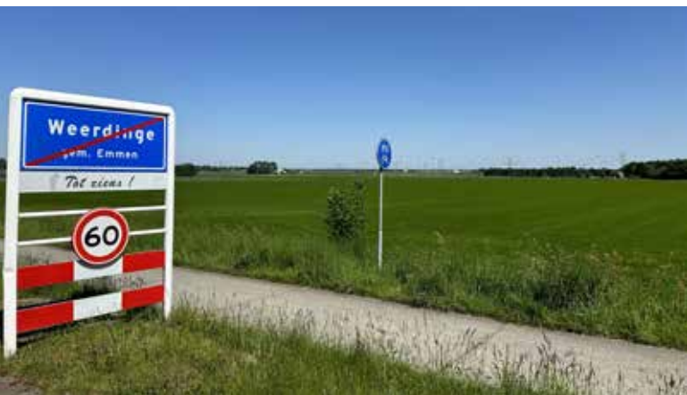
Afb. 14. (A. Eggens, 13 mei 2024)