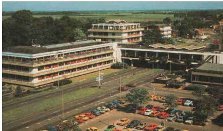
Afb. 9.

oude dierenpark. Onze jongste heeft er allang geen actieve herinneringen meer aan. Mooi dat de dieren in hun nieuwe onderkomens op de es meer ruimte hebben gekregen. Ik mis echter nog steeds de charme van de oude locatie. Juist om die reden kom ik niet graag in het hedendaagse Rensenpark.