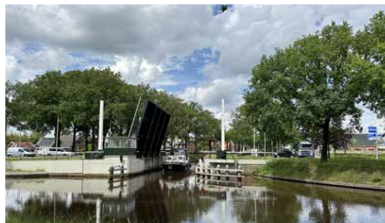
Afb. 20. (A. Eggens, 27 mei 2024)