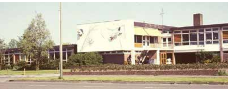
Afb. 5. ( http://kwebbel.org/?o=4 )