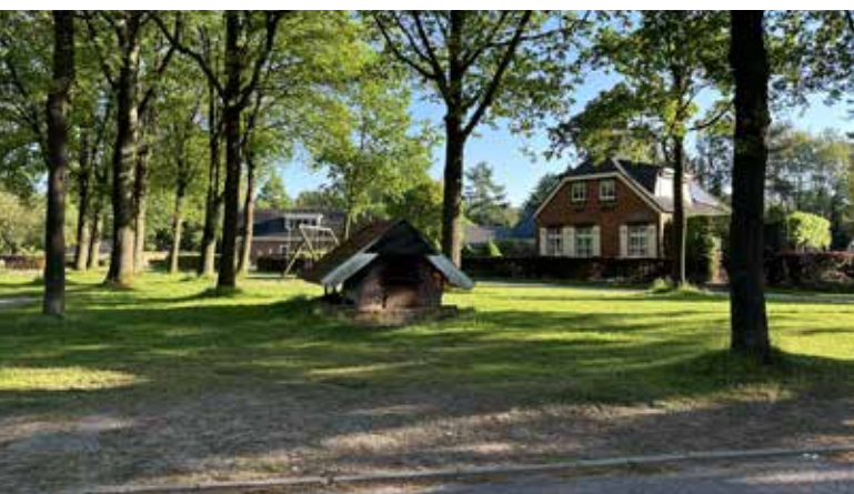
Afb. 4. (A. Eggens, 14 mei 2024)